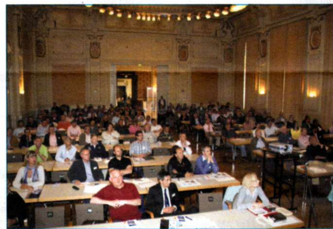
Das Auditorium in der historischen Stadthalle Wuppertal